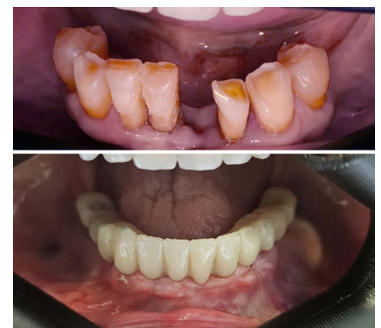
Ejemplo real: rehabilitación arcada inferior

Este enfoque proactivo no se limita al entorno de la consulta; la clínica también se involucra en la educación de sus pacientes, brindándoles información clara y precisa sobre la importancia del cuidado bucodental y cómo mantener una sonrisa saludable. De este modo, Dental García del Olmo se convierte en un aliado en la prevención, fomentando hábitos de higiene dental que previenen futuras complicaciones.