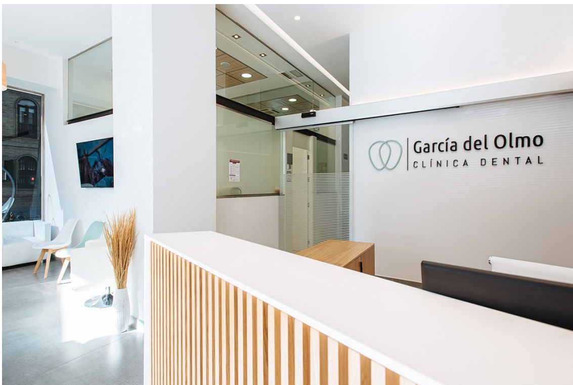
Clínica Dental García del Olmo

Clínica Dental García del Olmo, galardonada por el Diario LA RAZÓN como la mejor clínica de implantología dental de Andalucía, se ha consolidado como un referente en este campo, fruto de dos décadas de dedicación y esfuerzo conjunto de un equipo de profesionales altamente cualificados.