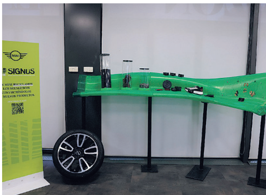
Signus colocó un expositor donde se pudieron ver los diferentes nuevos usos que pueden tener los neumáticos usados