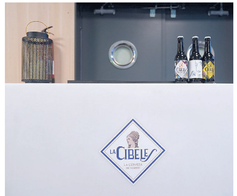
Las cervezas La Cibeles estuvieron presentes en la gala