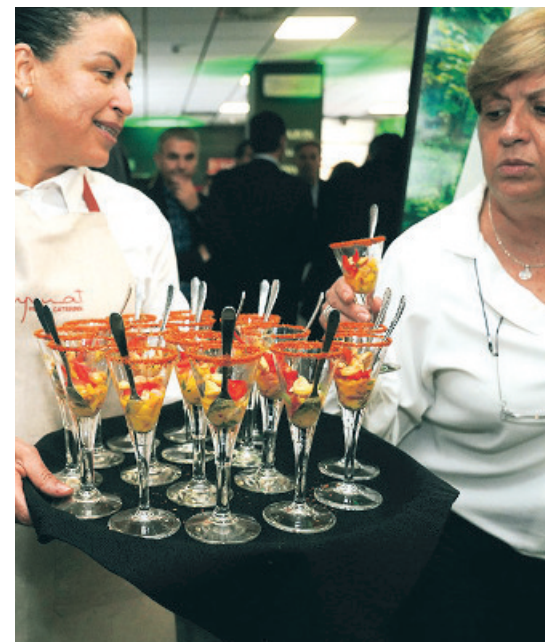
El ceviche de mango de Aymat Vegan Catering, una de las variedades servidas