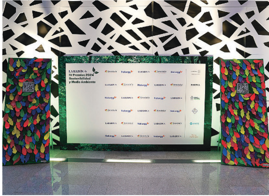
El photocall del evento estuvo rodeado por dos llamativos paneles de Murarte