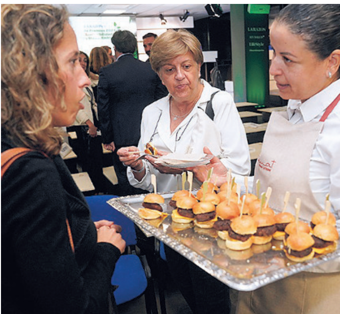
Una camarera de Aymat Vegan Catering ofrece hamburguesas veganas a los invitados