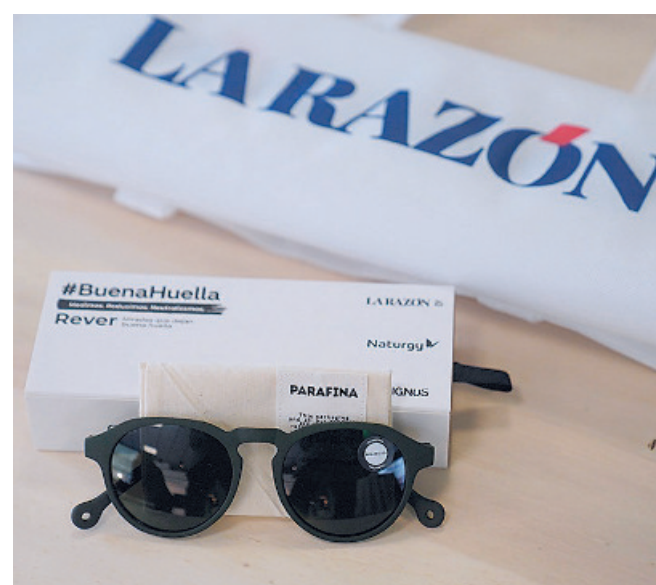
Los asistentes recibieron el obsequio de unas gafas Parafina, cuyas monturas estaban hechas de polvo de caucho reutilizado