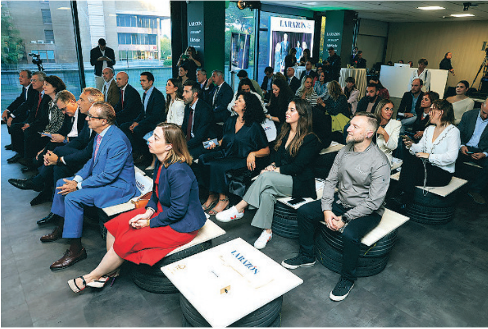
Vista general del salón de actos de LA RAZÓN, durante el evento