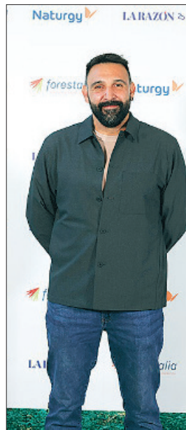
El escultor Gianluca Pugliese