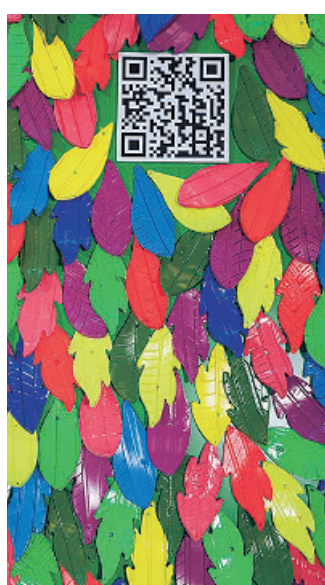
El mural de Murarte, tratado para reducir el CO 2 del aire