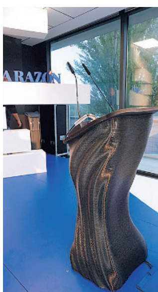
El atril del evento, impreso en 3D con neumáticos usados