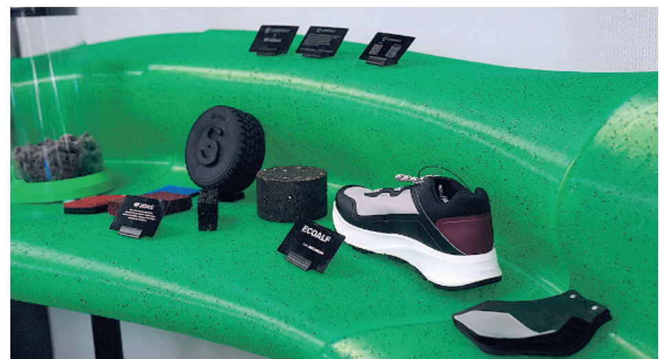
SIGNUS impulsa la economía circular reciclando toneladas de neumáticos fuera de uso

El broche de oro del proyecto ha tenido lugar con la celebración de la IV Edición de los Premios Sostenibilidad y Medioambiente de LA RAZÓN, un evento en el que todos los elementos han sido creados con un propósito sostenible. Asientos elaborados a partir de neumáticos y un tablero de madera de FSC; un atril producido a través de impresión 3D; laterales del photocall creados por la empresa MURARTE a través del efecto