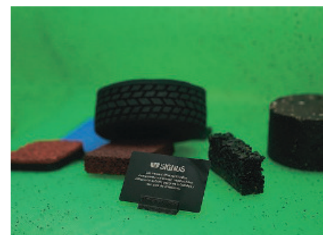
Collares y zapatillas son muestras de la transformación realizada por SIGNUS