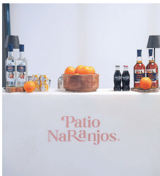
Los asistentes disfrutaron de los cócteles de Ron Patio Naranjos