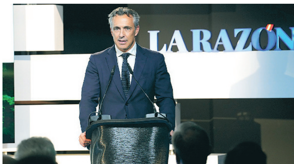
Carlos Novillo, consejero de Medio Ambiente, Agricultura e Interior de la C. de Madrid

Los asistentes al evento recibieron de obsequio unas gafas de sol Parafina producidas a partir de neumáticos fuera de uso, como ejemplo de sostenibilidad. Además, SIGNUS expuso en el salón donde se celebró el evento diversos productos de joyería, bisutería y calzado fabricados partiendo de los neumáticos usados o recauchutados, ofreciéndoles así una segunda vida.