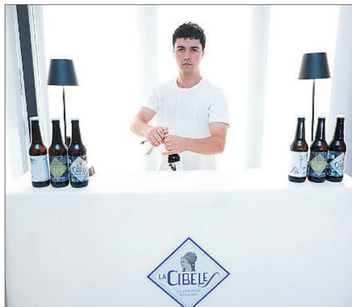
La Cibeles deleitó a los asistentes con su variedad de cervezas