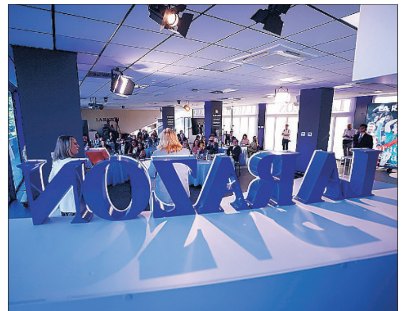
Vista general del salón de actos de LA RAZÓN, durante la gala