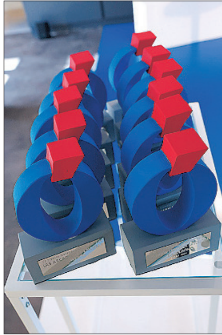
El galardón entregado a los premiados