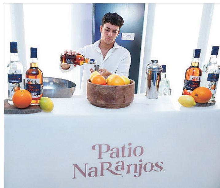
El Ron y la Ginebra de Patio Naranjos, patrocinadores de la gala, estuvieron presentes con su propio stand