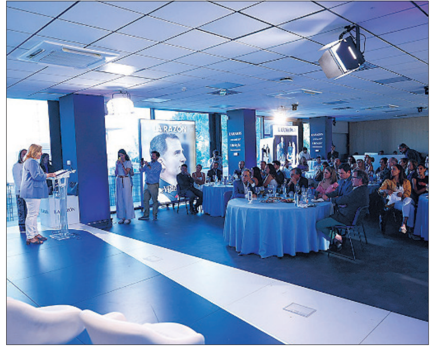
Instante en el que la vicealcaldesa dirigió unas palabras a los premiados