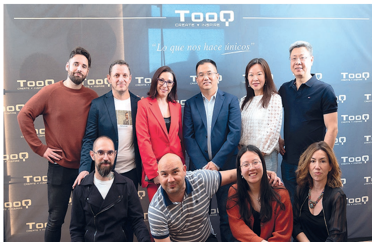
Equipo de TooQ