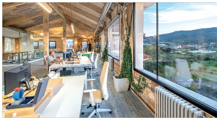
Nuevas oficinas TLS, The Learning Spaces (Seminario Derio)

Pensemos en una sala de interrogatorios del FBI, ¿cree que es posible estar cómodo en un espacio angosto y despersonalizado, repleto de superficies frías y reflectantes, sin luz natural y con una iluminación gélida, diseñado para que las personas que lo ocupen se sientan inseguras y cometan errores? Es evidente que no. Lo que tenemos que saber es que todas estas deci-