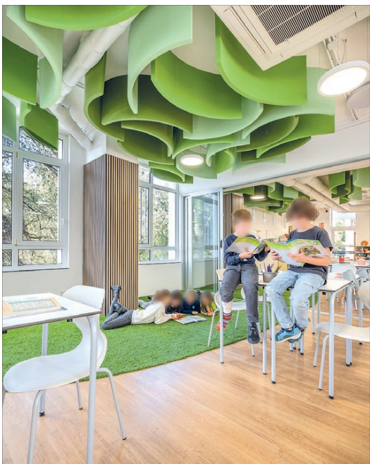
Aula de Primaria, Eguzkibegi Ikastola