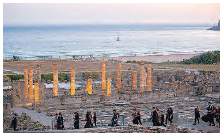
El conjunto Arqueológico Baelo Claudia está en Cádiz

ya destacada en la región es la Playa de Mónsul, famosa por su paisaje único y su arena fina. Rodeada de montañas y con formaciones rocosas peculiares, esta playa es una joya del sur. No obstante, cualquier paraje de Almería no dejará indiferente a nadie, ya que cuenta con las playas más buscadas en la red de España.