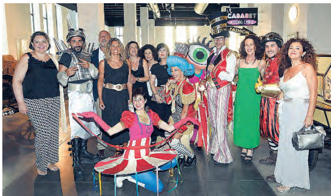
Los personajes de Concert Music Festival amenizaron el evento con sus coloridos disfraces