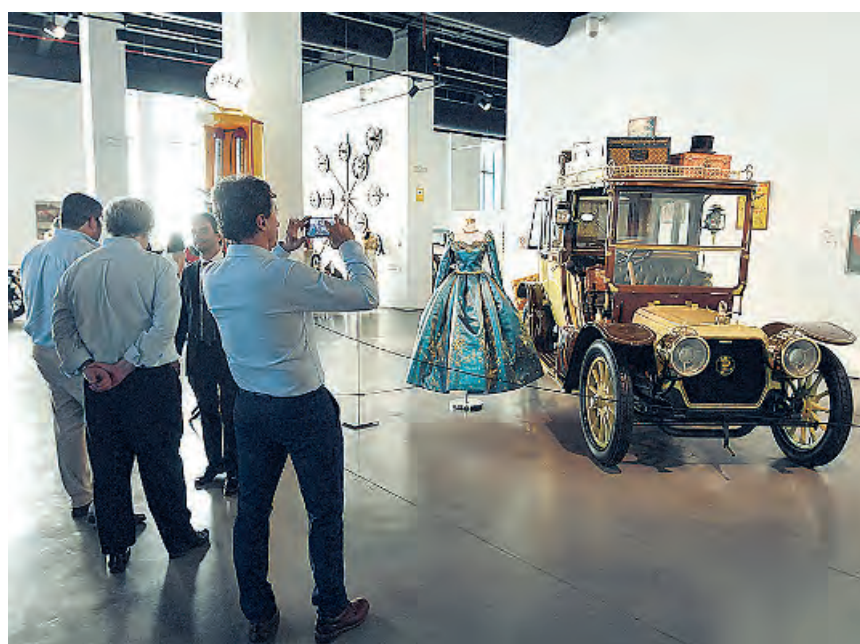
El acto se celebró en el Museo Automovilístico y de la Moda de Málaga