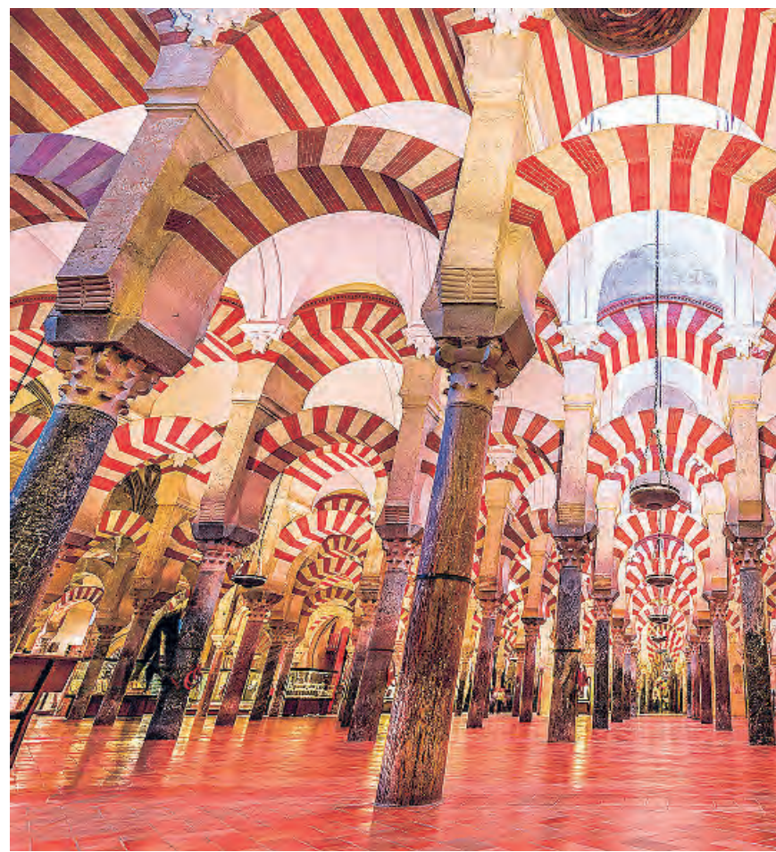
La Mezquita de Córdoba superó en 2022 el millón y medio de visitantes

Por último, Almería alberga, entre otras de gran belleza, la famosa Playa de los Genoveses, situada en el Parque Natural de Cabo de Gata. Este paraíso virgen se caracteriza por sus aguas turquesas y sus impresionantes acantilados. Otra pla-