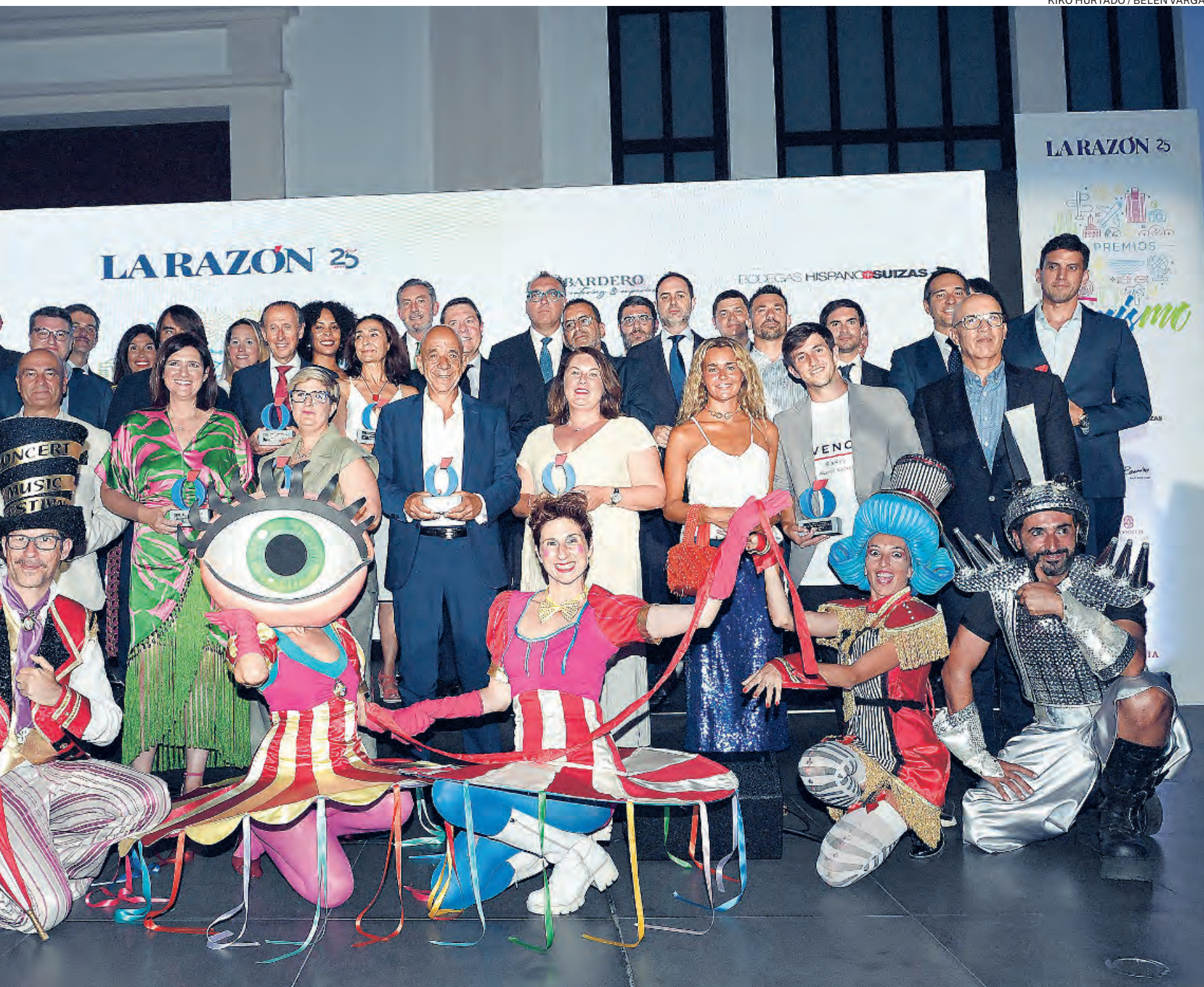
Foto de familia de todos los galardonados durante la XII edición de los Premios Turismo de LA RAZÓN celebrada la pasada semana en Málaga