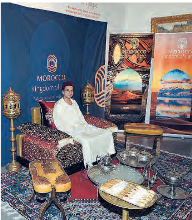
Turismo de Marruecos ofreció una degustación