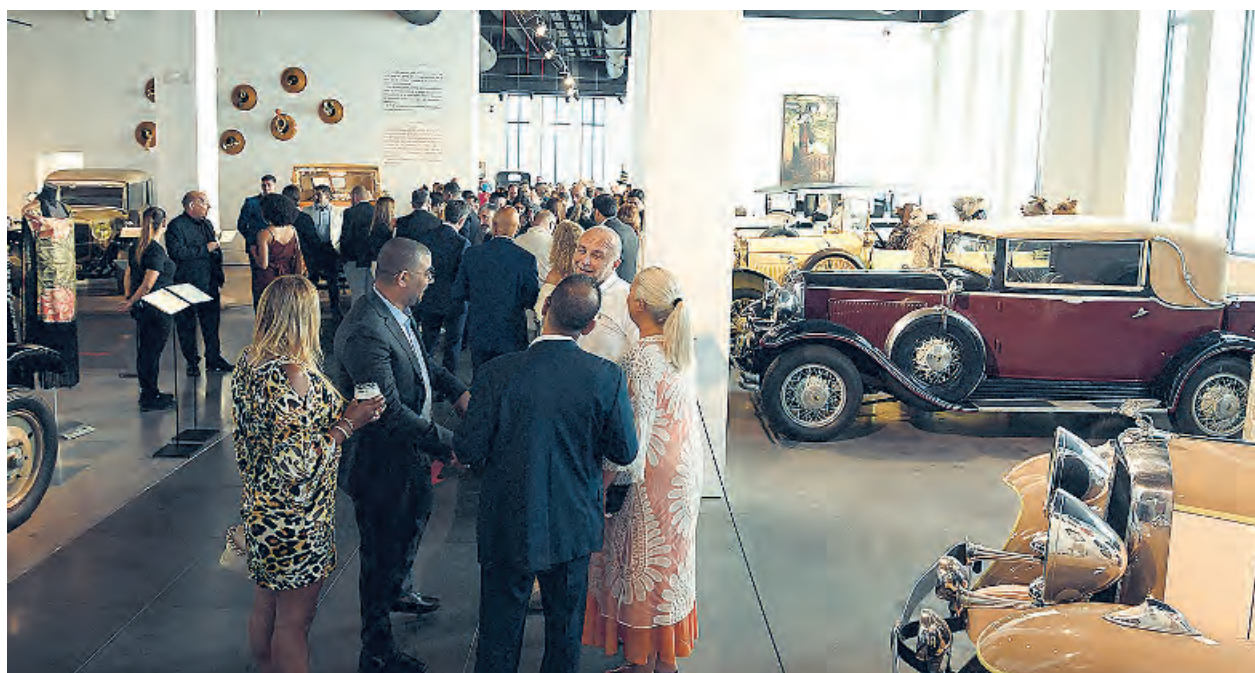
El Museo Automovilístico y de la Moda de Málaga acogió la XII edición de los Premios Turismo de LA RAZÓN