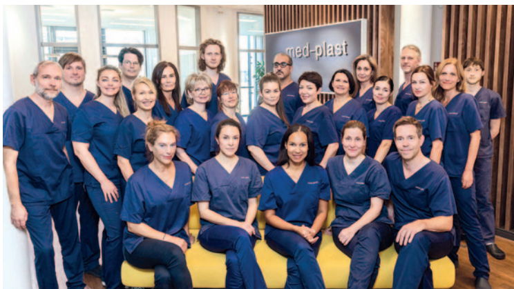
Una parte del equipo med-plast en Berlín: desde fisioterapeutas hasta nutricionistas y anestesistas especializados en lipedema.