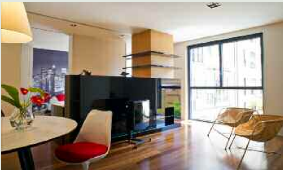
Apartamento en Paseo de Gracia

● Conviene matizar mucho los mensajes que todavía se lanzan al mercado respecto a la situación del sector inmobiliario residencial. Es momento de ser más preciso y generalizar diciendo que los precios de la vivienda seguirán bajando no es del todo riguroso; han caído hasta en un 35-40% en lugares y segmentos de mercado concretos, pero en el segmento de vivienda prime Barcelona o Madrid -como el que ocupa a Propiedades Singulares- los precios ya han caído lo suficiente y la escasez de producto no permite mayores caídas, ley de oferta y demanda. Es momento de ser rigurosos segmentando los mensajes acerca de la realidad inmobiliaria.