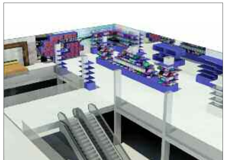
Diseño del interior de una tienda de lencería de hogar para posterior fabricación de maqueta

máquina o un proceso, Ingeniería SILSA 3D lleva a cabo simulaciones que permitan determinar si el diseño cumple con los requerimientos exigidos, ya sean de presión, temperatura o fuerzas mecánicas. Esto es, comprobar si las piezas físicamente van a funcionar como se es-