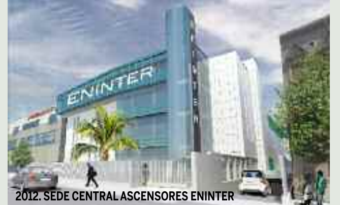
2012. SEDE CENTRAL ASCENSORES ENINTER

El proyecto más importante para el 2012 es la Sede central de ASCENSORES ENINTER, la principal empresa nacional de instalación y mantenimiento de ascensores. Actualmente en construcción