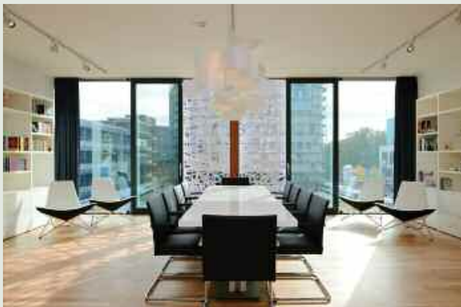
La gama Patio Life le posibilitará grandes Aperturas en cualquier estancia de su hogar

● Una de las decisiones estratégicas tomadas el pasado 2011 fue consolidar nuestra posición en el mercado del PVC y la madera, así como potenciar los productos donde