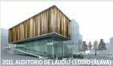
2011. AUDITORIO DE LAUDIO-LLODIO (ÁLAVA)

El proyecto más importante para el 2012 es la Sede central de ASCENSORES ENINTER, la principal empresa nacional de instalación y mantenimiento de ascensores. Actualmente en construcción