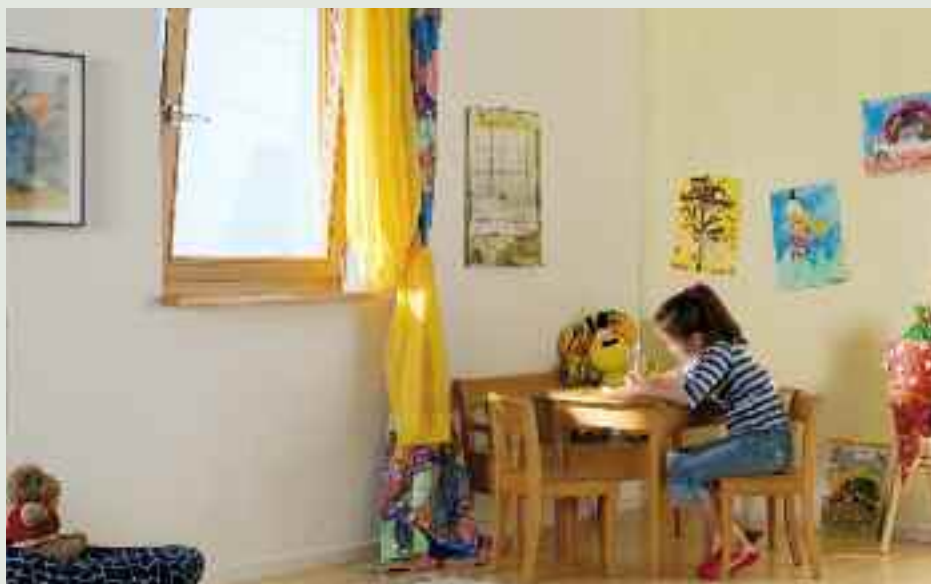
Ventanas de seguridad para estancias que han de estar permanentemente controladas