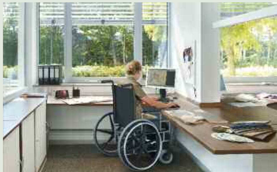
Ventanas Confort para hacer una vida más fácil a personas con movilidad reducida