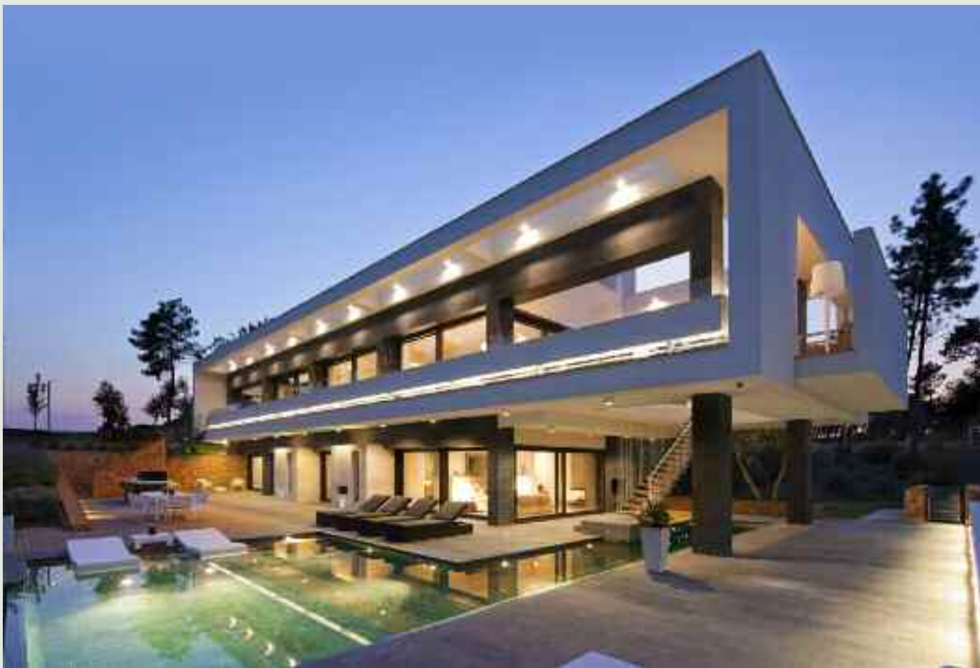
PGA Catalunya Golf Resort, Caldes de Malavella