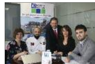
Equipo de trabajo de IC Maritime Services

Respecto a la especialización, es un concepto clave en este negocio. El sector de la logística y del transporte es un entramado que fluye sin detenerse nunca. Conocer cómo funciona