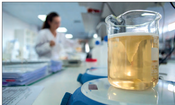
Centro de investigación en Madrid

Además, Industrial Farmacéutica Cantabria es más conocida por su inversión en labor social que publicitaria. Desde su trabajo y labor de apoyo al pueblo africano de Turkana a su involucración en la labor de difusión de valores con la Fundación “Lo que de verdad importa” IFC cree que los éxitos empiezan por las personas.