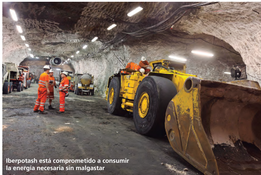
Iberpotash está comprometido a consumir la energía necesaria sin malgastar

Aura Light tiene un gran compromiso de contribución en favor de una sociedad más sostenible