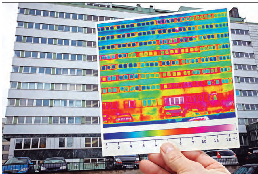
Pérdidas de calor a través en la fachada

Finalmente, los propietarios consiguen su edificio o vivienda mejorado, lo cual implica un aumento inmediato del valor del mismo, un incremento del confort y una disminución importante de sus gastos corrientes.