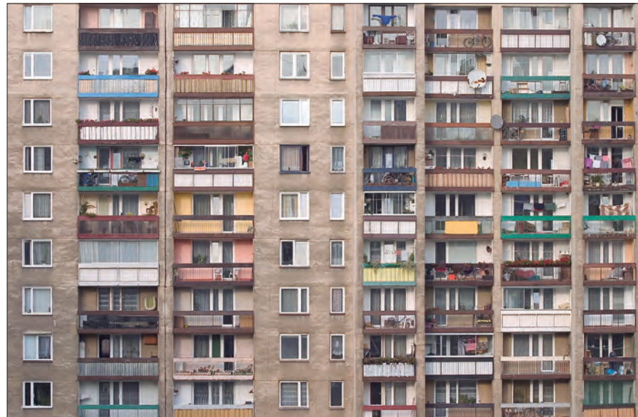
Edificio antes de su rehabilitación

Sin embargo, los propietarios desconocen que una rehabilitación energética no supone un sobrecoste frente a una tradicional y desconfían de un sector en el que el intrusismo ha hecho que sea difícil distinguir a buenos profesionales.