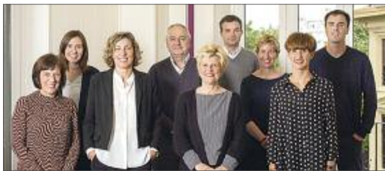
Equipo profesional de KNC Kemen Consulting

Por su parte, una de las principales novedades del Reglamento General de Protección de Datos que entrará en vigor el próximo año es la figura del Delegado de Protección de Datos (DPO). El nuevo Reglamento establece un estatus jurídico propio para el DPO, concede ciertas garantías frente al despido y regula su papel y su relación con la empresa. Frente a este