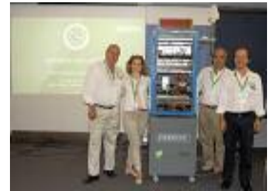
Evento MIFID II-Madrid 3/10/17

En la parte que nosotros cubrimos, la sincronización de tiempo, es importante identificar aquellos servicios que deben cumplir con MIFID II en que rango de resolución y exactitud deben estar y dotar a la infraestructura de IT implicada de los elementos de monitorización necesarios.