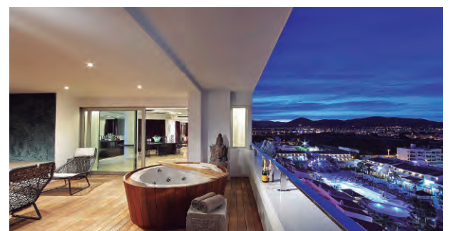
USHUAIA IBIZA BEACH HOTEL