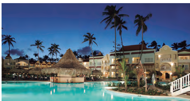
THE ROYAL SUITES TURQUESA BY PALLADIUM