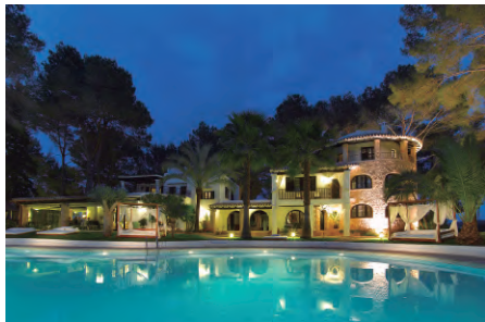
AGROTURISMO SA TALAIA