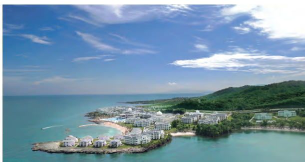
COMPLEJO GRAND PALLADIUM JAMAICA