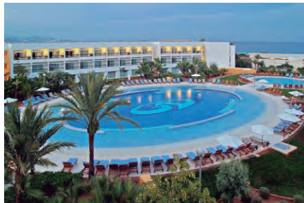
GRAND PALLADIUM PALACE IBIZA RESORT &amp; SPA